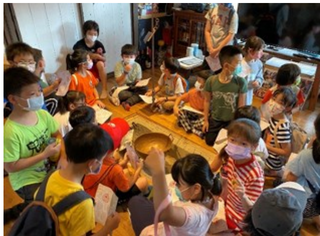
SOHO 工坊-原誠正國小第一任校長宿舍