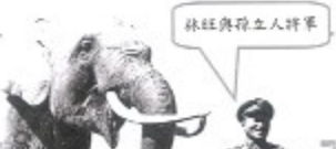
林旺與獨立人將軍