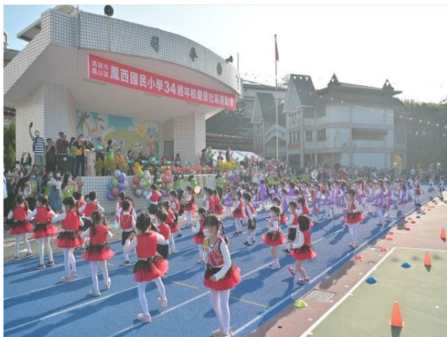
校慶開幕典禮：幼兒園妞妞體操及一年級小小世界舞蹈表演