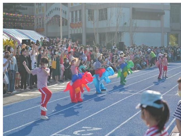
校慶開幕典禮：三年級三好歌及四年級好品格隊呼表演