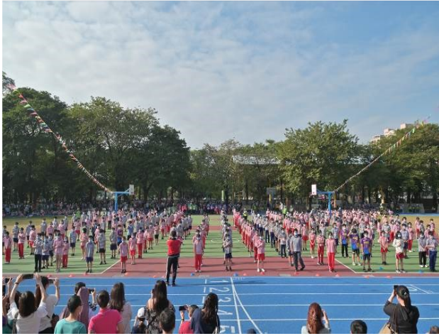
校慶開幕典禮：五年級 handclap 及六年級我相信舞蹈表演