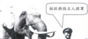
林旺與獨立人將軍