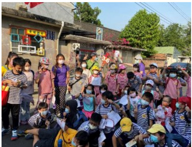
舊官舍裡看水壓汲水器