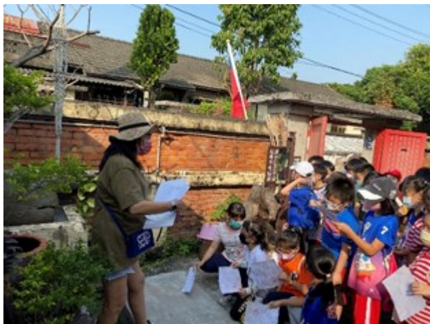
眷舍前方型消防沙坑